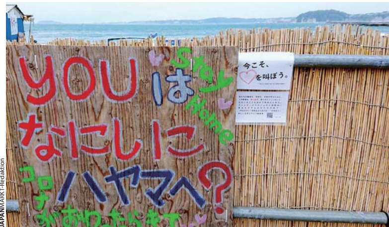
▲ Die „Golden Week“ wurde dieses Jahr wegen der Coronavirus-Pandemie zur „Stay Home Week“ deklariert.

Die Maßnahmen, die auf Basis des GSNI im Notstand in Japan